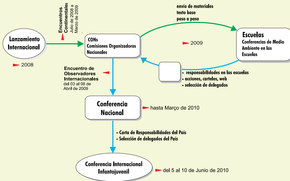
Figura 1 - Proceso de la Conferencia Internacional Infantojuvenil

La Figura 1 ilustra el proceso que se sugiere y sus plazos: